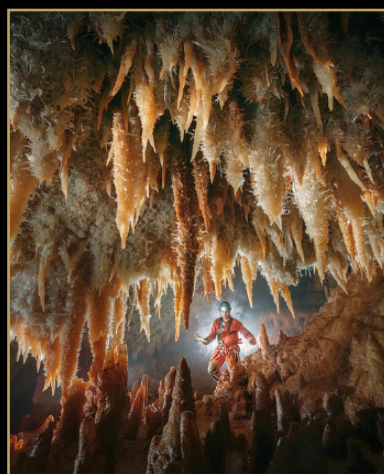
PREMIER PRIX Rémi Flament - France