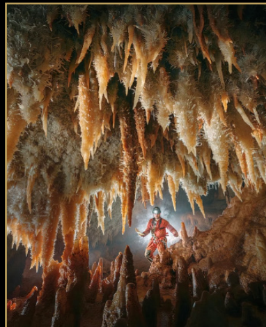
PRIMER PREMIO Rémi Flament - France