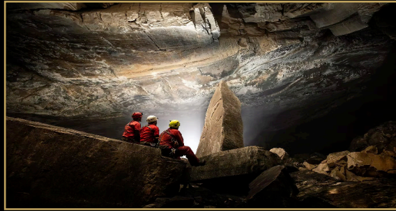
PRIMER PREMIO Kasia Biernacka - Polonia